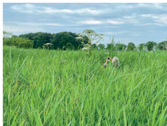
Resie Schlooz fotografeert de berenklaauw in Pasgeld.