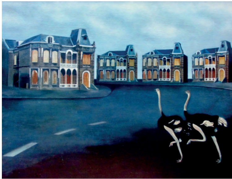
Werk van Winnifred Bastian, gebaseerd op het oude raadhuis van Vrijenban.